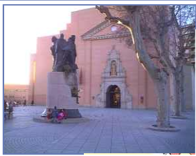
Auditorio San Francisco