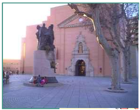
Auditorio San Francisco